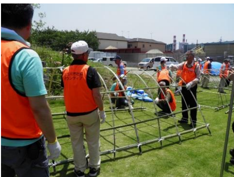
▲昨年災害ボランティア研修の様子

加古川市社会福祉協議会では、県内外で災害が起こった時に迅速かつ効果的に支援活動が展開できるよう災害時支援ボランティア事前登録をしています。